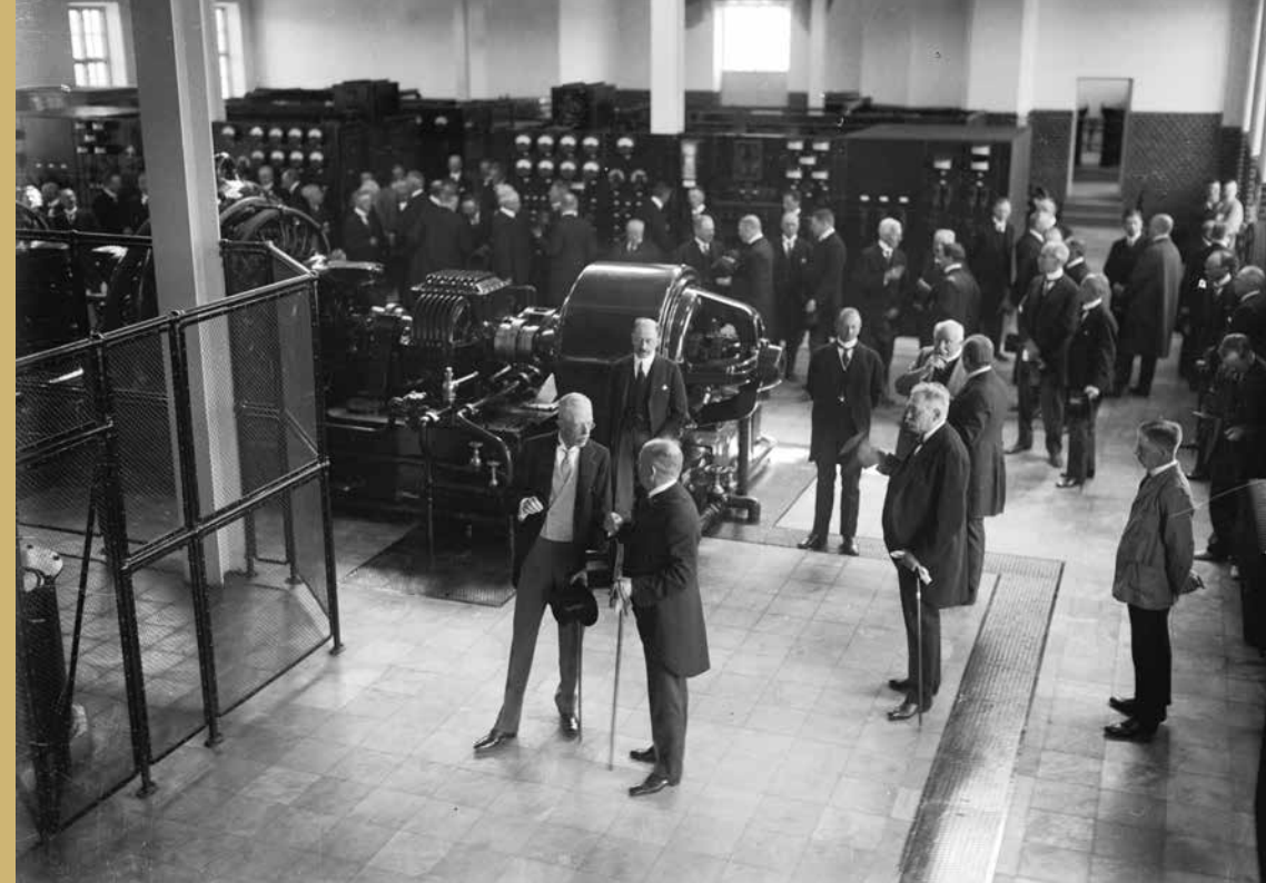
Calegi/Hällands kulturhistoriska museum